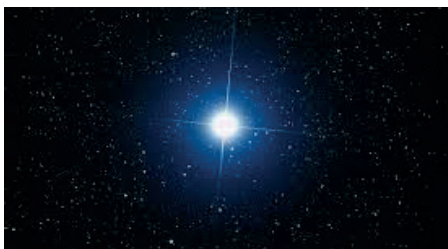
Regulus ist der hellste Stern im Sternbild Löwe. Der lateinische Name Alpha Leonis bedeutet Kleiner König oder Prinz. Regulus bildet zusammen mit den Sternen Arktur und Spica das Frühlingsdreieck.

Durch ein spezifisch entwickeltes Monitoring-Programm wird die IT-Infrastruktur im laufenden Betrieb rund um die Uhr überwacht. Tritt ein Problem auf, intervenieren die Infortix-Spezialisten umgehend und informieren die